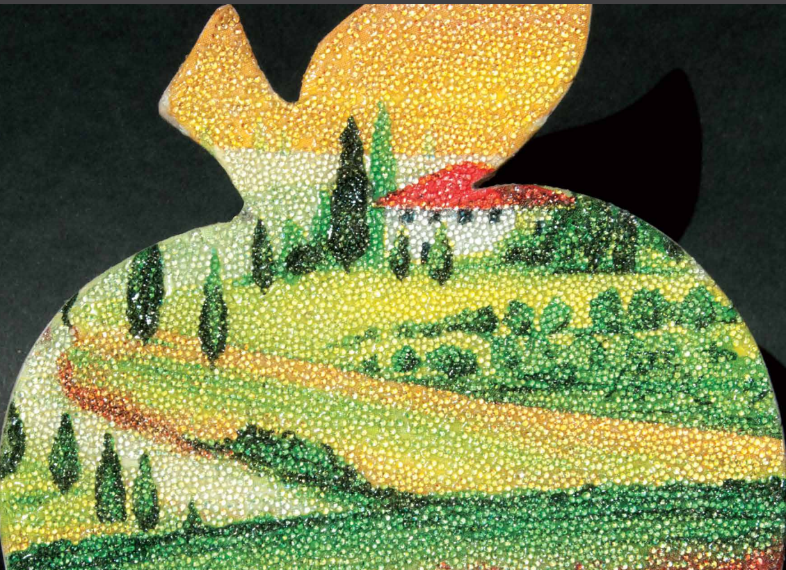
КРИСТАЛЬНАЯ ПАСТА ПОВЕРХ ИЗОБРАЖЕНИЯ

Кристалльная паста подходит для декорирования любой основы: дерево, стекло, зеркало, керамика, гипс и др. После высыхания пасты получается яркая, блестящая рельефная поверхность.